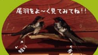
尾羽の短い方がメス、長い方がオスだよ。

ツバメ ぼくらは人が生活してるところにしか巣を作らないよ。大事な子どもたちを守ってもらえるからね。だけどそれでもカラスやヘビなんかにかまれることもあるから油断はできないんだ。あとスズメ!ぼくらと同じような場所に巣を作るから、先に目をつけられると厄介なんだ。せっかく作った巣を壊しに来たりするし、場所選びに毎年苦労してる。ぼくらのウンチがたくさん落ちるからって嫌がる人たちも多いけど、ぼくらが巣を作るってことはそれだけよく人が出入りしてるってことだし、にぎやかでいいと思わない?それにぼくらは稲の害虫も食べるからたんぼにとっても役に立ってるはず。ぼくらが巣を作る家は栄えるとか、田の神様をしょって来るとか、幸せを運んでくる鳥だって昔から言われてるんだよ。