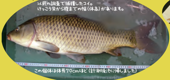
以前の調査で採獲したコイ。けっさう背から腹までの幅(体高)があります。