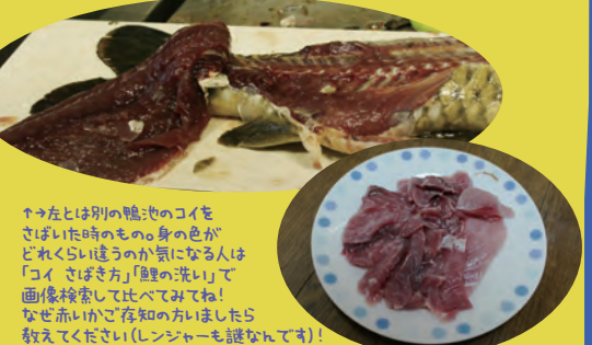
↑こちらは別の鴨池のコイをさばいた時のもの。身の色がどれくらい違うのか気になる人は「コイ さばき方」の巻の巻いて画像検索して比べてみてね! なせ赤いかご存知の方いましたら教えてください(レンジャーも読んでね!)

我々の口...いや 吻 には歯がない。このため魅など軟らかいものしか食べぬと思われておることもあるようだが、 タニシやエビ なども平気で食べる。のどに歯があるからな。人間どもは 咽頭歯 というらしいが、これのおかげで硬いものでも 飲み込みながらすりつぶして 食らうことができるのだ。歯がないから嚙まないだろうと迂闊に指を出すことのないように。のどの奥まで吸い込まれたらどうなるかわからぬぞ。なんでも食べるゆえか、少々水質がよろしくなくても生きられるゆえか、我々はしばしば異国の地では 侵略的外来種 として扱われてしまうこともある。日本におけるブラックバス、正しくは オオクチバス と同じ扱いを受けているのだ。まだまだ言いたいことはあるのだが息が続かん。機会を見てまた話しに来るので心して待つように。あと鴨池で我々を釣りに上げようなどという変な気を起こすでないぞ。池の主の 崇り があるやもしれんからな。然らば 御免! *池のヌヤ崇りのあるなしに関わらず鴨池での釣りは禁止されています。