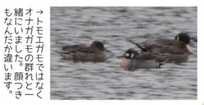
オトモエガモとオナガガモの群れとは違う顔つき。オトモエガモはくもななだか違います。