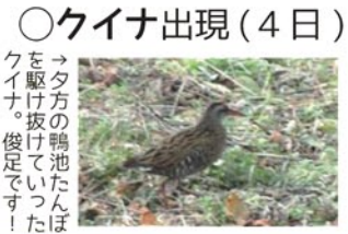
クを→トモエガモ、イナ→オナガガモ、俊足でいっしょにたぼ