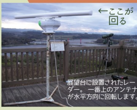
←ここが回る 展望台に設置されたレーダー。一番上のアンテナが水平方向に回転します。

今回は船舶航行用のレーダーを使って飛行ルートを記録し、マガンたちが風車を避けているかどうかを調べました。2月19日から25日までの朝と夕方に、あわら北潟風力発電所展望台「風羽里(ふわり)」にレーダーを設置し、マガンが北潟湖を通過するルートを観測します。レーダーの観測は日本野鳥の会のみなさん、朝の飛び立ち時刻の確認と連絡は観察館レンジャー、夕方の飛び立ち時刻の確認と連絡を日本野鳥の会福井県のみなさんで分担しました。